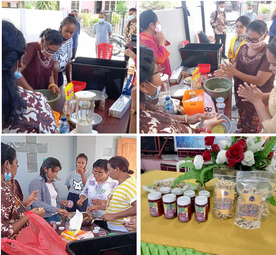
Gambar 1. Praktek pembuatan produk olahan ikan tembang yaitu stik, sambal luat dan stik ikan tembang.

Setelah penyampaian materi dilanjutkan dengan praktek pengelolaan varian stik ikan tembang berbagai rasa, kerupuk ikan tembang, rengingang ikan tembang dan sambal luat ikan tembang. Proses pengolahan dibuat menggunakan mesin cetak dan menjaga kualitas kebersihan dari produk stik, kegiatan ini dapat dilihat pada Gambar 1.