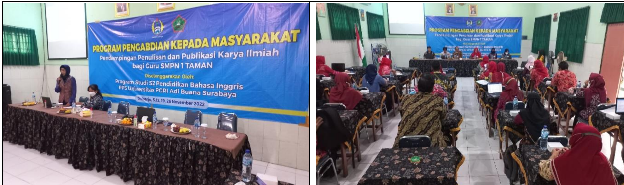
Gambar 1. Pelatih yang sedang melakukan ekspositori materi (kiri) dan para guru SMP Negeri 1 Taman, Sidoarjo (Kanan)

Setiap sesi memberikan kuis untuk menjadi informasi pengetahuan dan pemahaman para guru tentang tema yang tersebut. Tema Penulisan Karya Ilmiah dan Publikasi pada Online Journal System Menyusun 10 pertanyaan dan balikan dari para guru peserta dapat dilihat pada Tabel 2. Peserta yang memberikan respon terhadap kuis adalah 19 orang dari total peserta 30 orang.