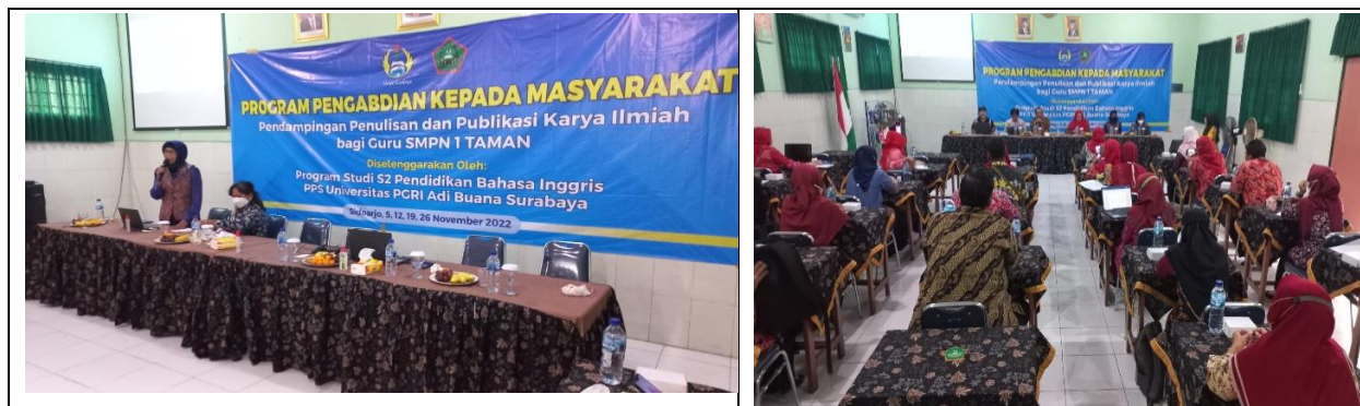
Gambar 1. Pelatih yang sedang melakukan ekspositori materi (kiri) dan para guru SMP Negeri 1 Taman, Sidoarjo (Kanan)